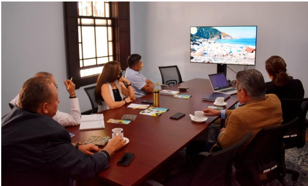
Personal de la COPRESAM conociendo el proceso de reciclaje de Green Plastic

Personal de la COPRESAM busca incorporar procesos de formación y sensibilización y campañas educativas en las municipalidades para que estas cuenten con alternativas al tratamiento de la basura en los municipios. Por ello se llevó a cabo una reunión con representantes de la empresa Green Plastic, para conocer el proceso de reciclaje de plástico, que posteriormente convierten en piezas de uso familiar, educativo y comercial, contribuyendo a la sensibilización del proceso de reducir, reutilizar y reciclar. Con estas acciones la COPRESAM busca más actores que se sumen al esfuerzo gubernamental, municipal y social para limpiar los municipios.