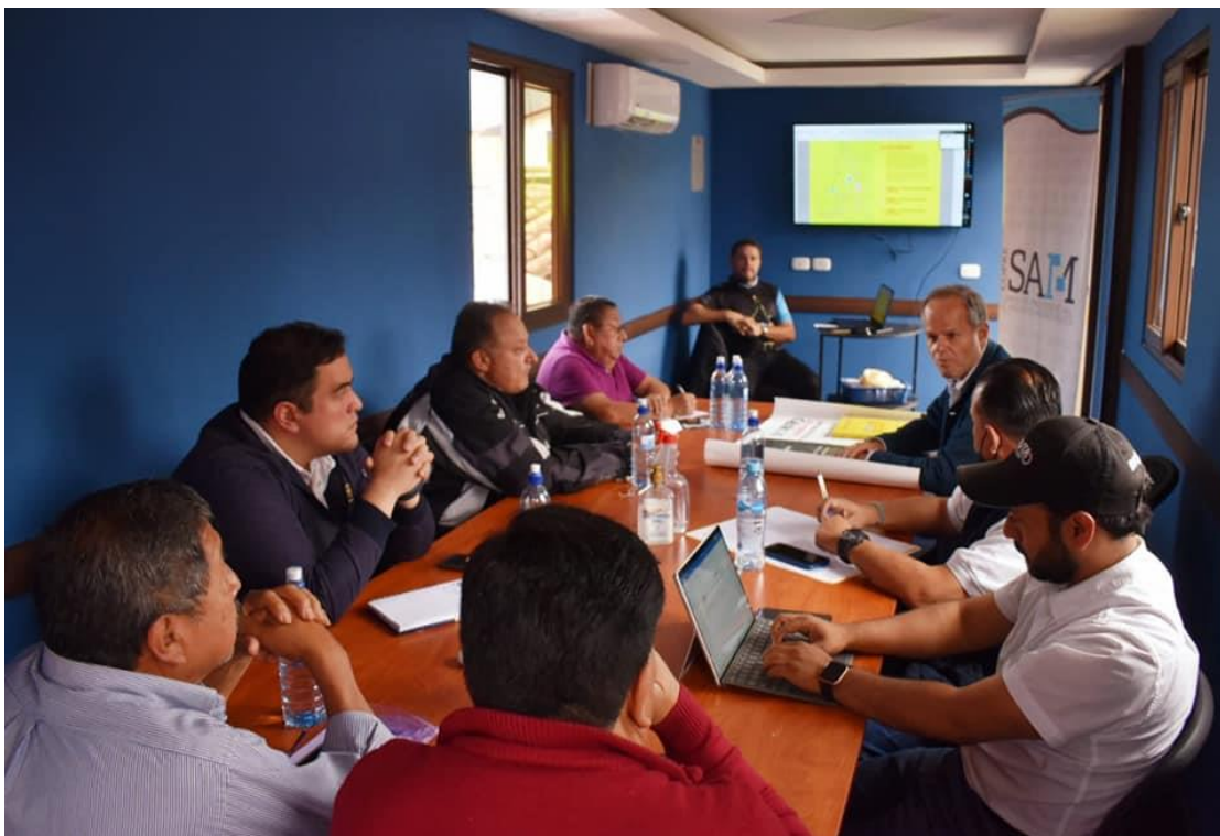
Reunión de la COPRESAM, Nueva Narrativa y la municipalidad de Jocotenango

Se realizó una reunión entre la COPRESAM, el Fondo de Solidaridad Social -FSS-, representantes de la municipalidad de Antigua Guatemala y el Ministerio de Comunicaciones, Infraestructura y Vivienda -CIV-, para apoyar la implementación de la Biciruta en uno de sus tramos principales.