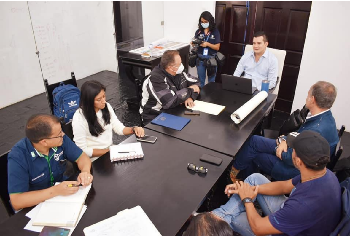
Participación en reunión con Nueva Narrativa para definir acciones de seguimiento