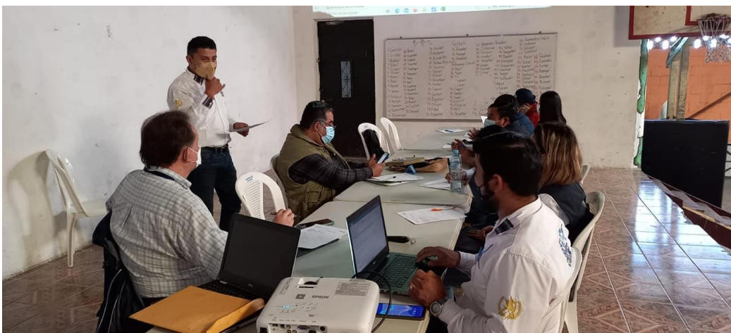
Visita a la municipalidad de Patzicía, para dar a conocer la estrategia de las OMAS