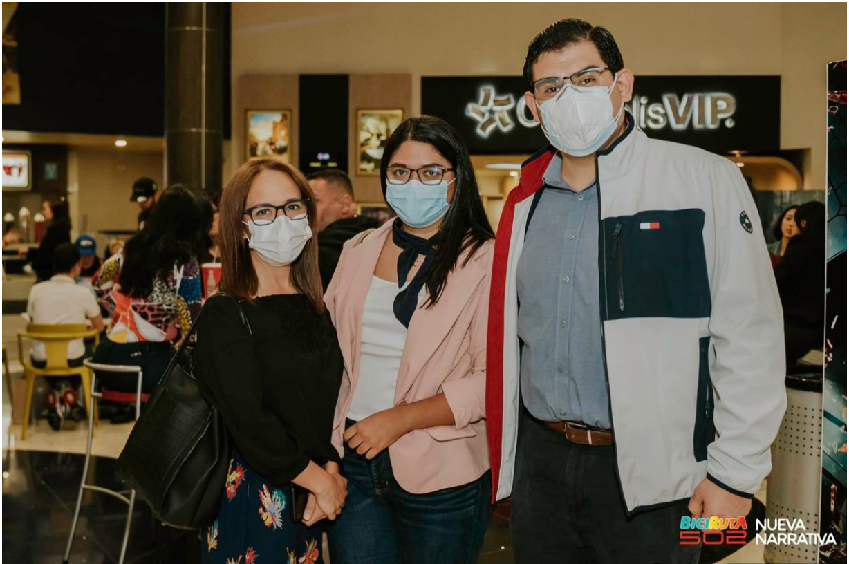
Presentación del documental Biciruta502, día 9 de agosto

Se ha dado acompañamiento a varias reuniones de trabajo con personal de la Nueva Narrativa, continuando con las acciones para llevar a cabo la implementación de esta ruta, abordando el tema de la ubicación y colocación de los estacionamientos de bicicletas en los cuatro municipios involucrados, esto incluyó una reunión con los tres alcaldes y sus Concejos Municipales para abordar esta propuesta.