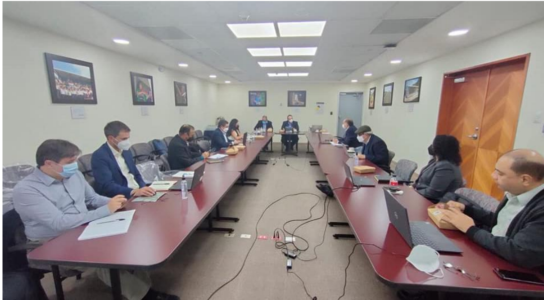
Presentación de la COPRESAM sobre resultados de las OMAS, ante delegación del BID

Posteriormente en el mes de julio, El director ejecutivo de la COPRESAM y el director de Fortalecimiento a Mancomunidades, participan en una siguiente actividad realizada en el departamento de San Marcos, en la cual representantes del BID verifican el avance de los proyectos financiados en seis municipios de dicho departamento, proyectos gestionados a través del INFOM, quien a su vez presentó los avances y el proceso de finalización de estos proyectos.