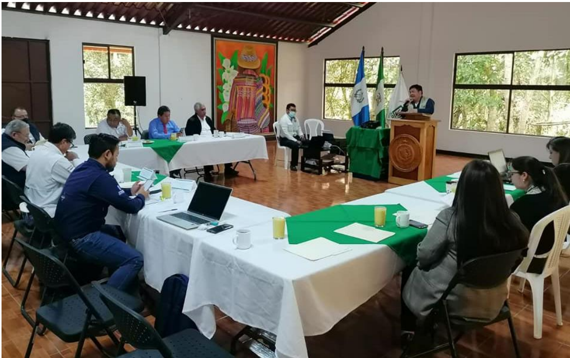
Participación en reunión de seguimiento del Consejo Asesor del Área Protegida Reserva Forestal Protectora de Manantiales, Cordillera Alux

Como parte del seguimiento a estas acciones, durante el mes de mayo, se lleva a cabo una reunión, en la cual se plantea la importancia de crear estrategias, planes de protección y aprovechamiento del recurso natural, enfocados a la conservación del área protegida del Cerro Alux, dentro de los acuerdos alcanzados se acordó que, para las reuniones de seguimiento, se convocará a participar a la COPRESAM como un ente facilitador de este importante proceso.