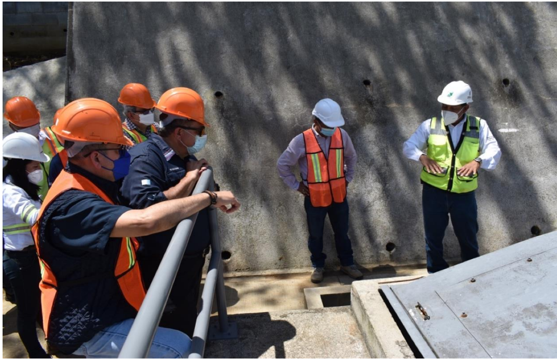
Recorrido en 2 plantas de tratamiento financiadas por el BID, en San Pablo, San Marcos