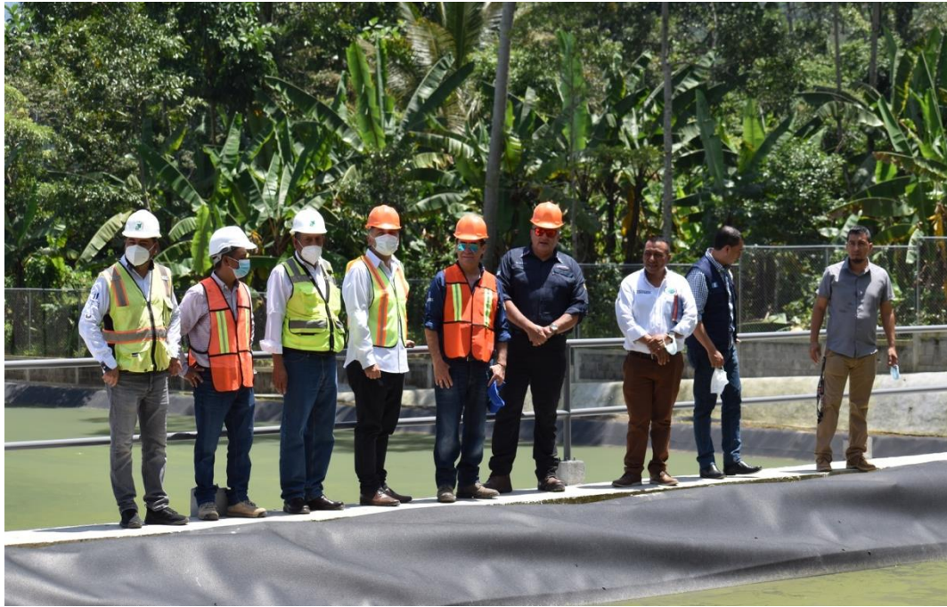
Recorrido en 2 plantas de tratamiento financiadas por el BID, en San Pablo, San Marcos