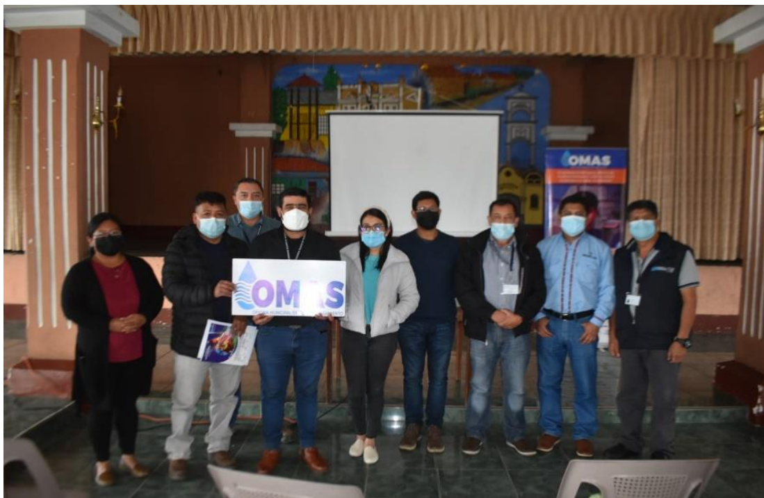
Visita a la municipalidad de Magdalena Milpas Altas, Sacatepéquez Para dar a conocer la estrategia de las OMAS