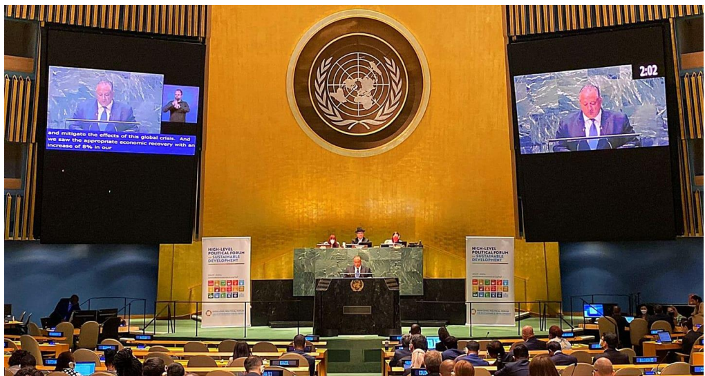
Participación del director ejecutivo de la COPRESAM en el Foro Político de Alto Nivel sobre Desarrollo Sostenible, de Naciones Unidas