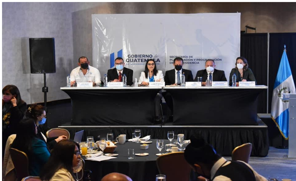
Participación del director ejecutivo de la COPRESAM en la presentación del Ranking Municipal 2020-2021