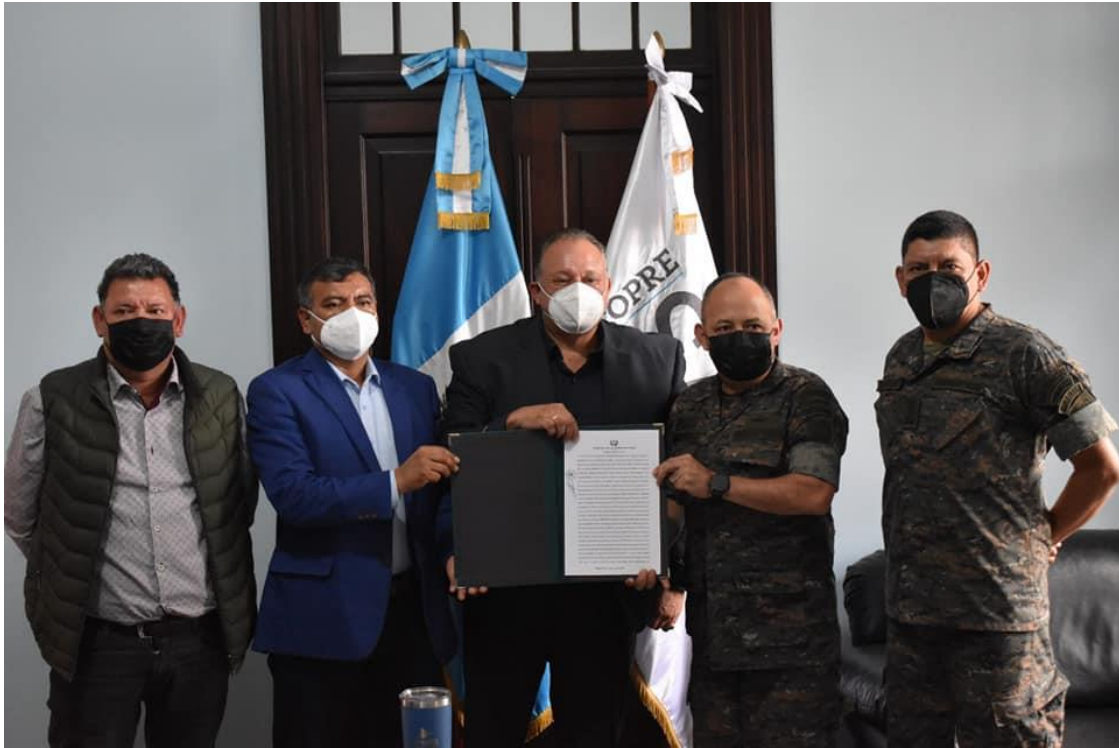
Firma del Convenio entre la municipalidad de Santa Lucía Milpas Altas y el Cuerpo de Ingenieros del Ejército de Guatemala

convenio, la municipalidad junto con el Cuerpo de Ingenieros del Ejército de Guatemala, deberán continuar con las acciones correspondientes para dar paso a la perforación del pozo en mención.