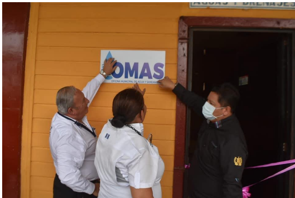
Actividad de inauguración de la OMAS en la Democracia, Escuintla