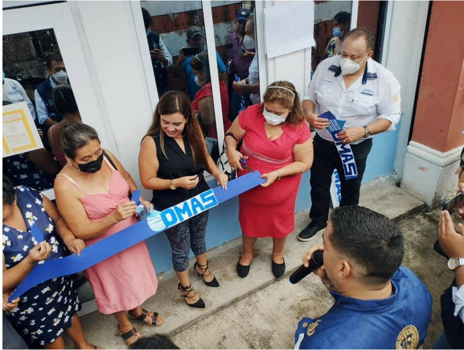
Inauguración OMAS en San Martín Zapotitlán