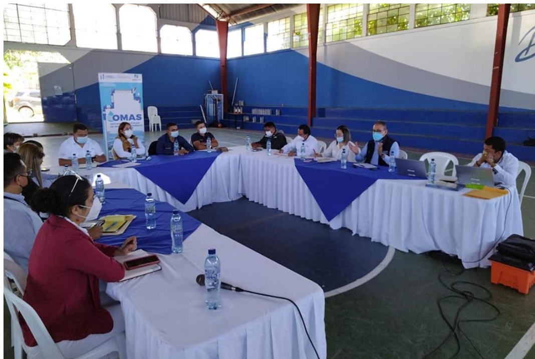
Visita a la municipalidad de Fraijanes, para dar a conocer la estrategia de las OMAS