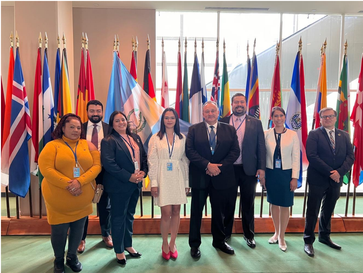
Participación del director ejecutivo de la COPRESAM en el Foro Político de Alto Nivel sobre Desarrollo Sostenible, de Naciones Unidas