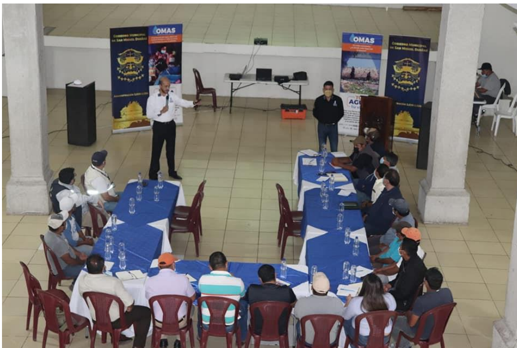
Visita a la municipalidad de San Miguel Dueñas, para dar a conocer la estrategia de las OMAS