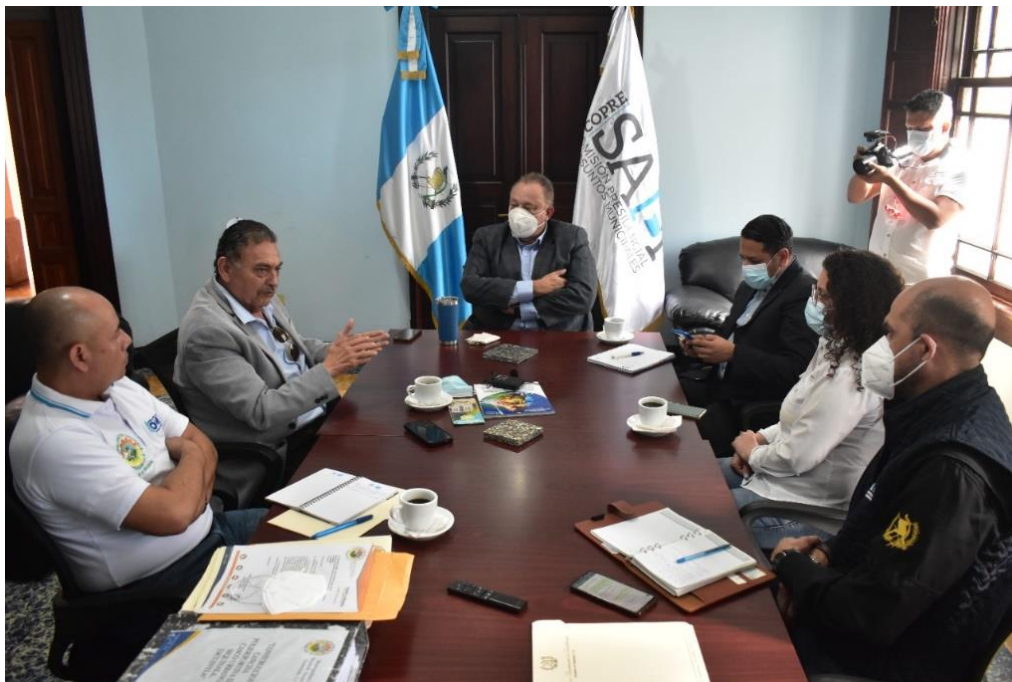
Reunión de seguimiento de la COPRESAM a la municipalidad de Siquinalá, Escuintla, para el acompañamiento a expedientes