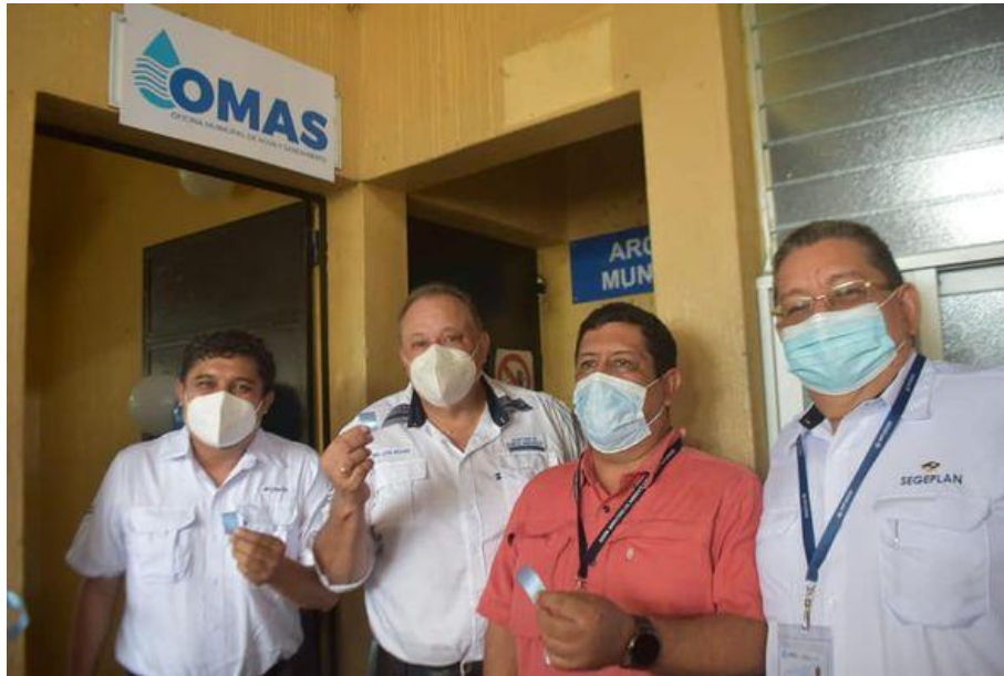
Actividad de inauguración de la OMAS en Santa Cruz Muluá, Retalhuleu