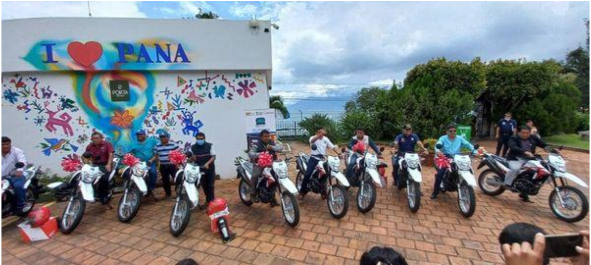
Participación de la COPRESAM en actividad para la entrega de motocicletas a personal de las OMAS en SOLOLÁ

La COPRESAM a través de la Dirección de Gestión Municipal participó en esta actividad, manifestando la importancia de la gestión del agua y saneamiento de manera adecuada para reducir los índices de desnutrición en el país.