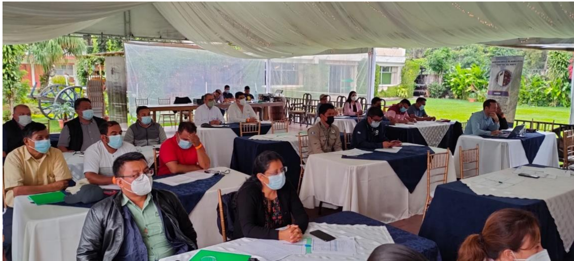
Participación de la COPRESAM en el encuentro de mancomunidades organizado por MANCUERNA y USAID-HEP+