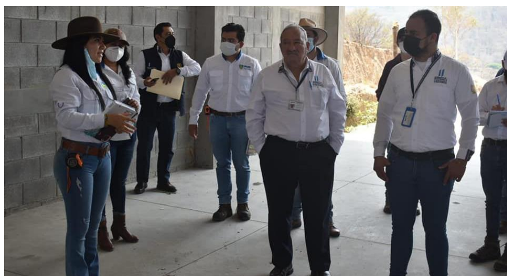
Visita técnica al vertedero de desechos de Palencia, Guatemala