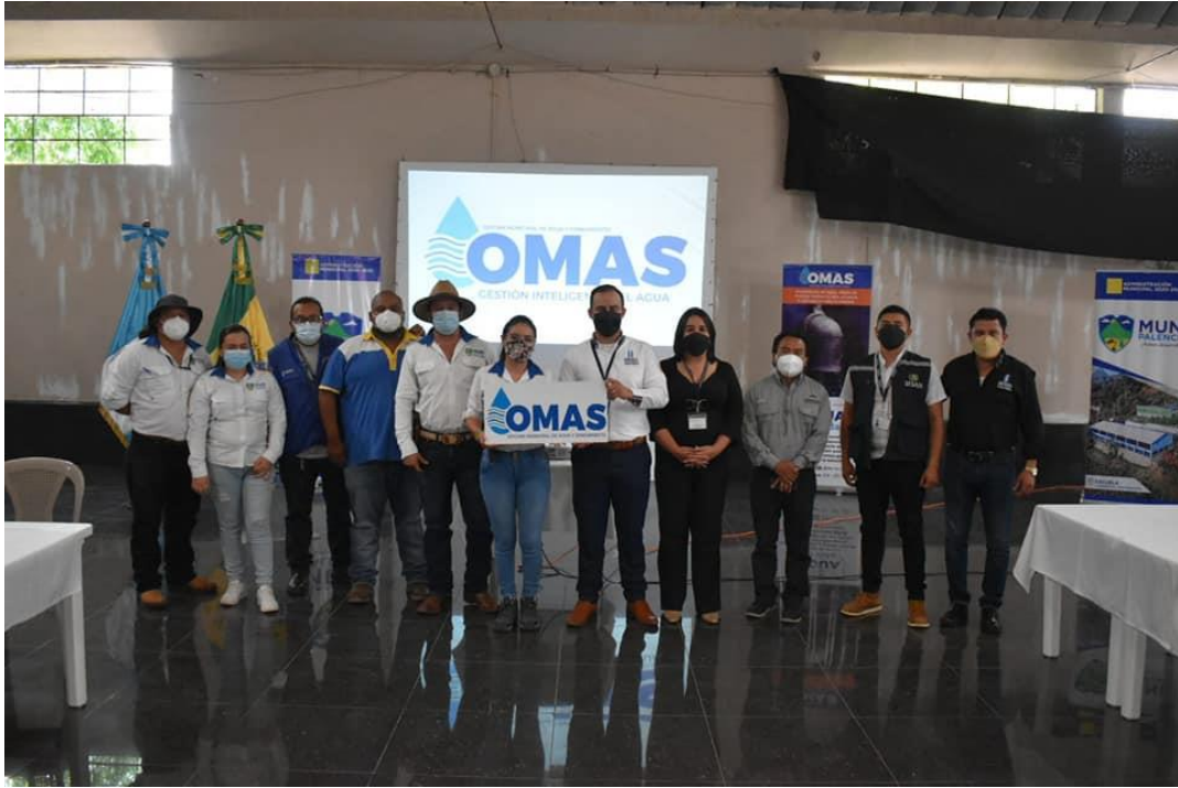
Visita a la municipalidad de Palencia, para dar a conocer la estrategia de las OMAS