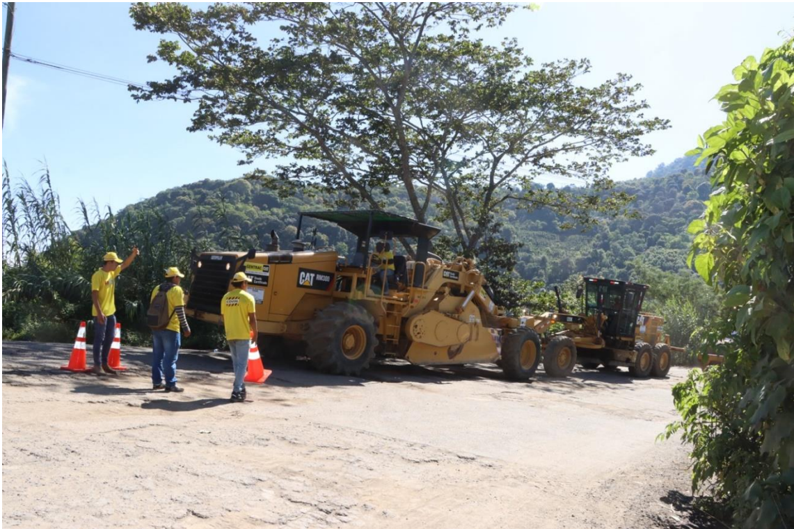
Inician los trabajos de bacheo en el tramo carretero entre la Comunidad Agua Escondida y San Lucas Tolimán, Sololá