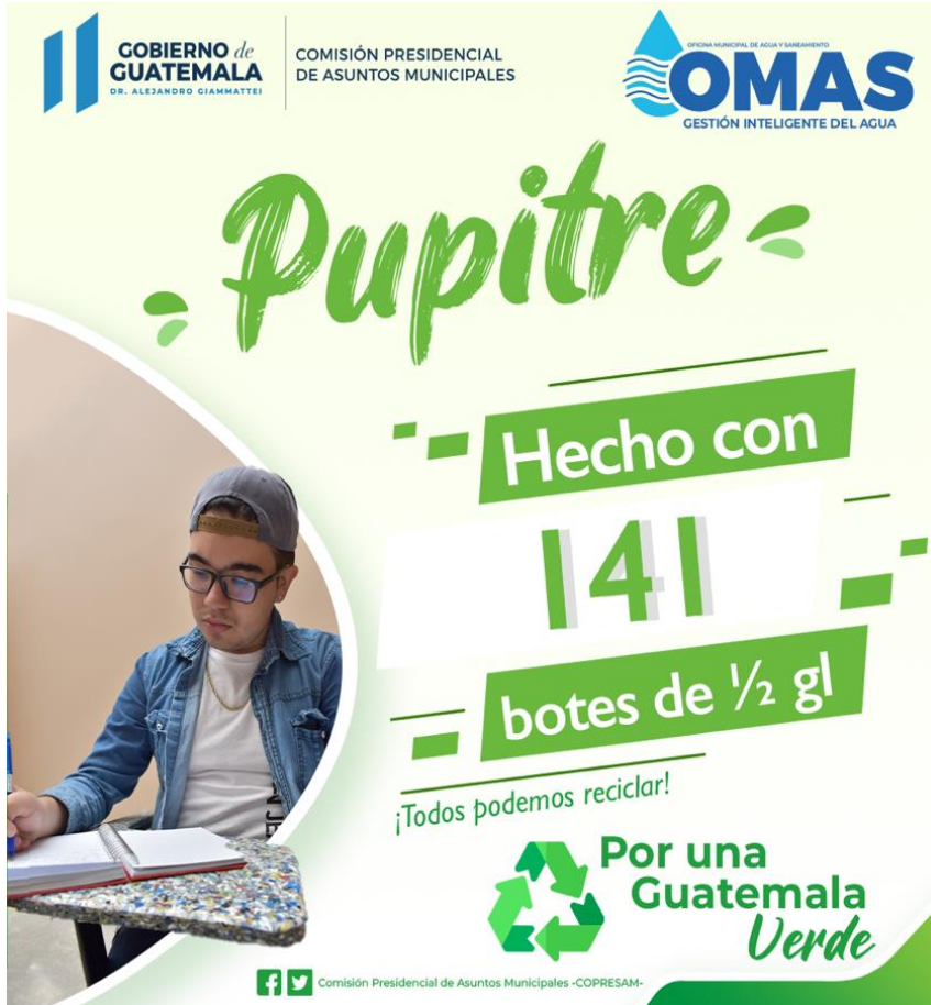
Campaña de la COPRESAM de sensibilización para el reciclaje