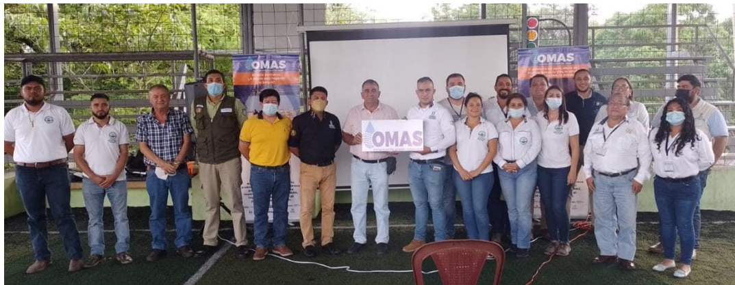
Visita a la municipalidad de San Agustín Acasaguastlán, para dar a conocer la estrategia de las OMAS