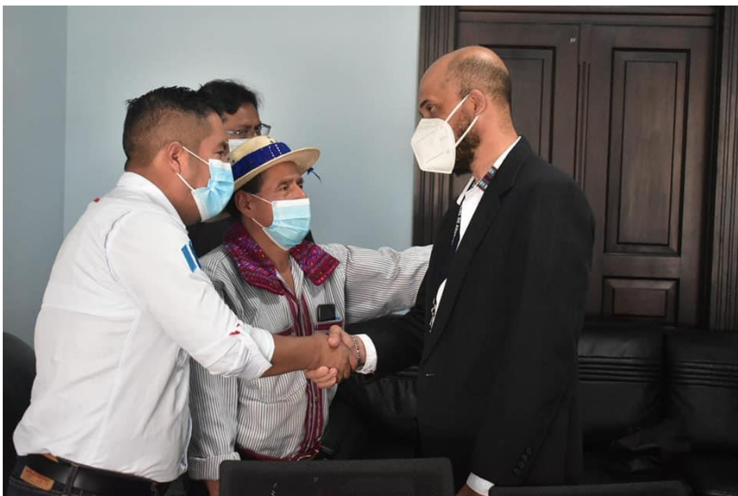
Reunión del día 23 de agosto entre la COPRESAM, el CIV, municipalidad de Todos Santos Cuchumatán para seguimiento al proceso para la construcción de tramo carretero