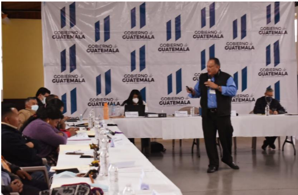
Proceso de diálogo con pobladores del Valle Palajunoj, Quetzaltenango