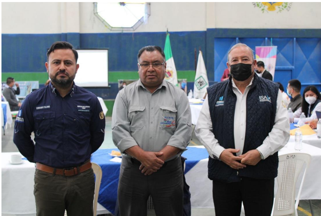
Reunión del 16 de agosto del Consejo Asesor para la conservación del Cerro Alux, en Sacatepéquez