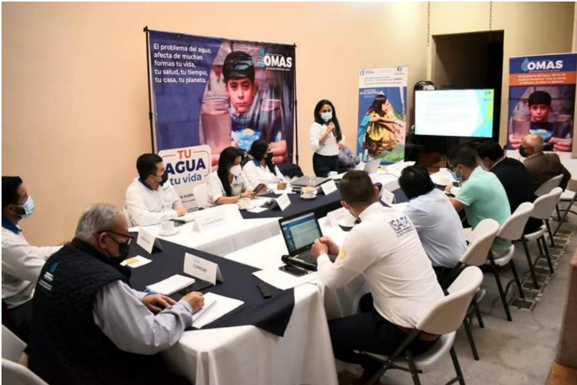
Presentación de la municipalidad de Palencia sobre avances en los estudios para la ampliación de la PTDS

Posteriormente a esta visita, se lleva a cabo una mesa técnica en la cual la municipalidad de Palencia presenta los avances en los estudios para la ampliación de esta planta de tratamiento. Los representantes de MARN y FODES realizaron sus observaciones para que la municipalidad continúe con el proceso de la conformación del expediente.