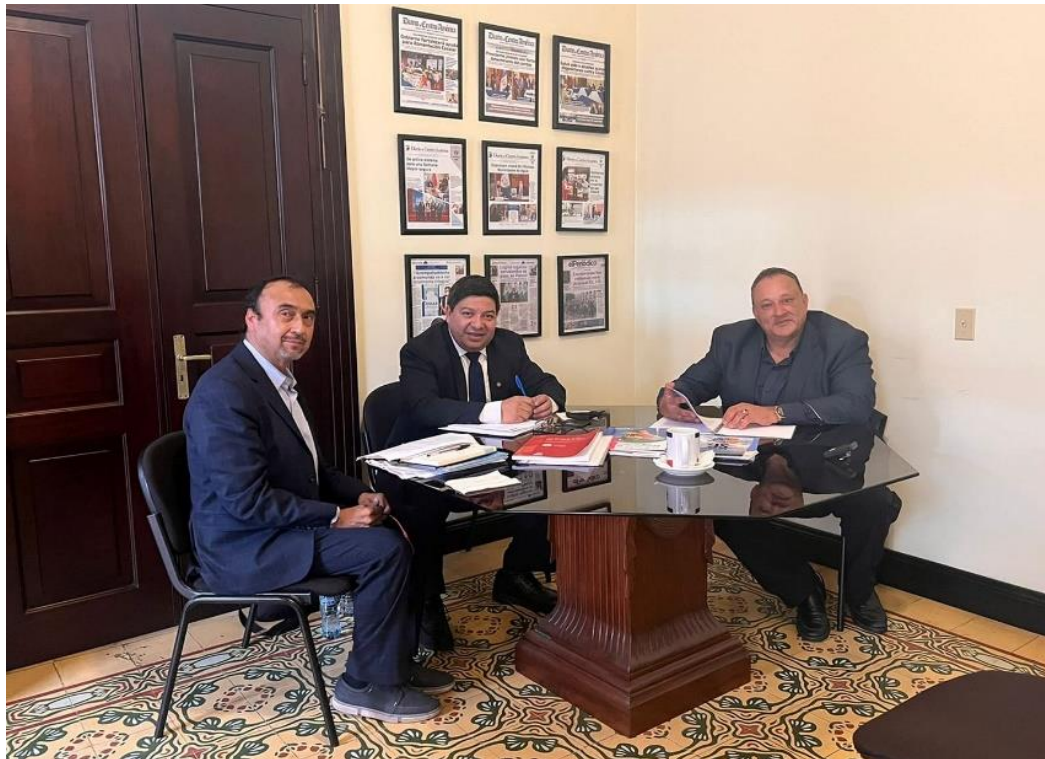
Reunión con el delegado presidencial y el asesor del viceministerio del MARN

Esta visita del delegado del BID, da seguimiento a una reunión virtual realizada con anterioridad, debido al interés de dicha entidad para apoyar al país en temas relacionados a medio ambiente, cambio climático, así como a temas en agua y saneamiento.