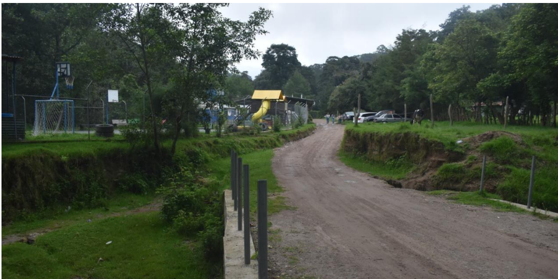
Reunión y recorrido para abordar el tema del mejoramiento de carretera entre Tecpán y Patzún

Posteriormente se lleva a cabo una siguiente reunión de trabajo y un recorrido en el área de la carretera en mención. Luego de analizar las peticiones solicitadas, se acuerda entre los involucrados proveer una nueva ruta de acceso al tramo en construcción entre los municipios de Patzún y Tecpán. Todas estas acciones contaron con el acompañamiento de la COPRESAM, para facilitar los acercamientos.