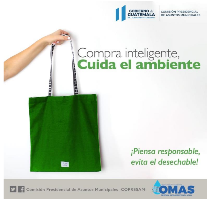
Campaña de la COPRESAM de sensibilización para el reciclaje