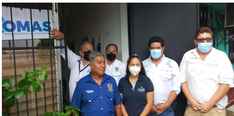
Actividad de inauguración de la OMAS en San Lorenzo, Suchitepéquez