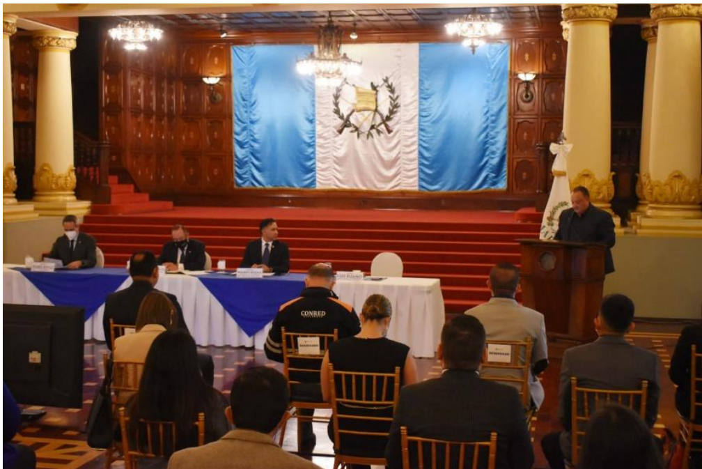
Presentación del director ejecutivo de la COPRESAM en el Lanzamiento del "Proceso de Descarbonización y Mesa Técnica para la Reglamentación del Agua"

Al finalizar esta actividad, se instauraron las mesas técnicas, para abordar el tema de la reglamentación del agua y la descarbonización.