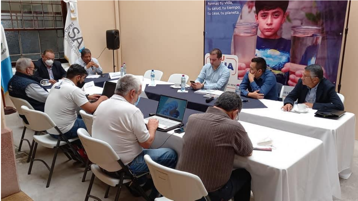
Primera reunión en instalaciones de la CORPESAM, con representantes de la municipalidad de Tecpán y la empresa SBI Internatioal Holdings AG

Posteriormente se lleva a cabo una siguiente reunión de trabajo y un recorrido en el área de la carretera en mención. Luego de analizar las peticiones solicitadas, se acuerda entre los involucrados proveer una nueva ruta de acceso al tramo en construcción entre los municipios de Patzún y Tecpán. Todas estas acciones contaron con el acompañamiento de la COPRESAM, para facilitar los acercamientos.