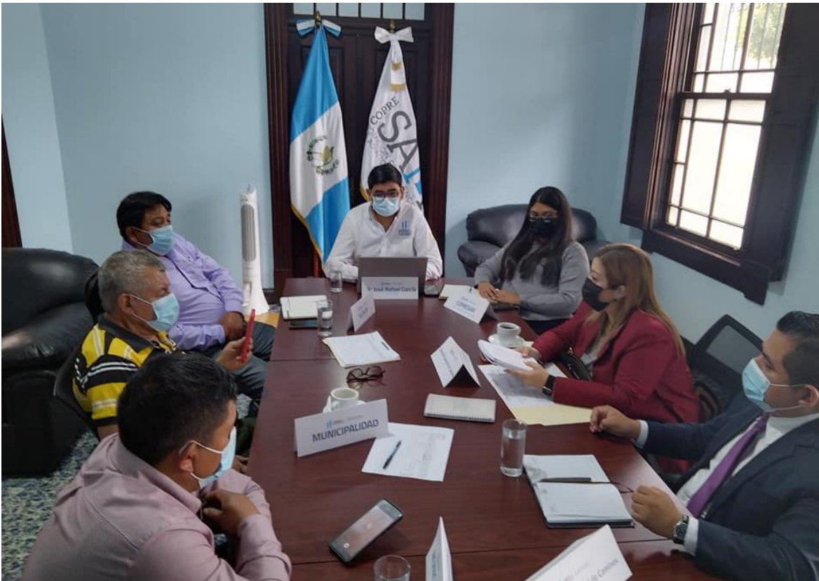
Reunión con representantes de la municipalidad de Santa Bárbara, Huehuetenango, para abordar tema del mantenimiento a carretera

Desde el mes de abril, y a petición del alcalde municipal, la COPRESAM ha coordinado acciones de acompañamiento a la municipalidad de Santa Bárbara, quienes solicitan apoyo para agilizar un proceso relacionado al mantenimiento para la rehabilitación de la carretera que da acceso a la cabecera municipal de dicho municipio, este proceso se encontraba detenido desde hace aproximadamente catorce años, por problemas jurídicos con la empresa constructora.