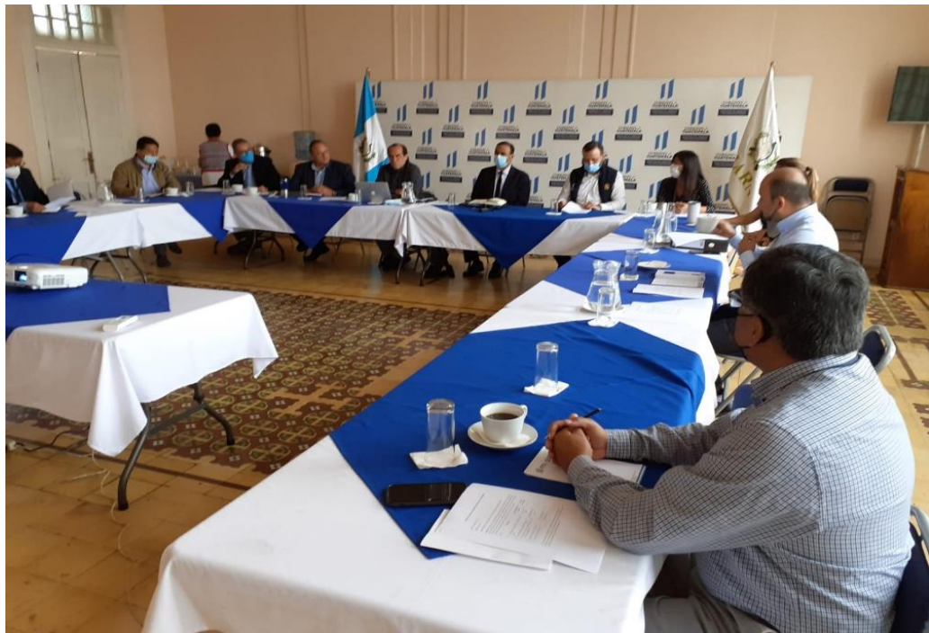
Participación de la COPRESAM en mesa técnica para la segunda fase del Programa “Agua y Saneamiento Humano” del BID

En esta reunión participaron representantes de la SEGEPLAN, MIDES, SESAN, INFOM, MAGA, la COPRESAM y el equipo consultor del BID.