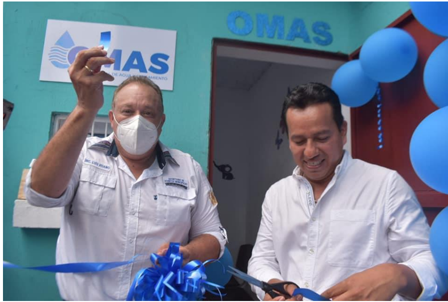
Inauguración OMAS en San Felipe, Retalhuleu

Otra de las acciones importantes que se desarrollaron en estos municipios a partir de la creación de la mancomunidad, es la actividad desarrollada el día tres de marzo en Retalhuleu, con la cual se dio inicio a la gira para promover la implementación de los PDM-OT, acción que se trabajó en coordinación con la SEGEPLAN. En dicha actividad estuvieron presentes representantes de Santa Cruz Muluá, San Martín Zapotitlán y San Felipe Retalhuleu.