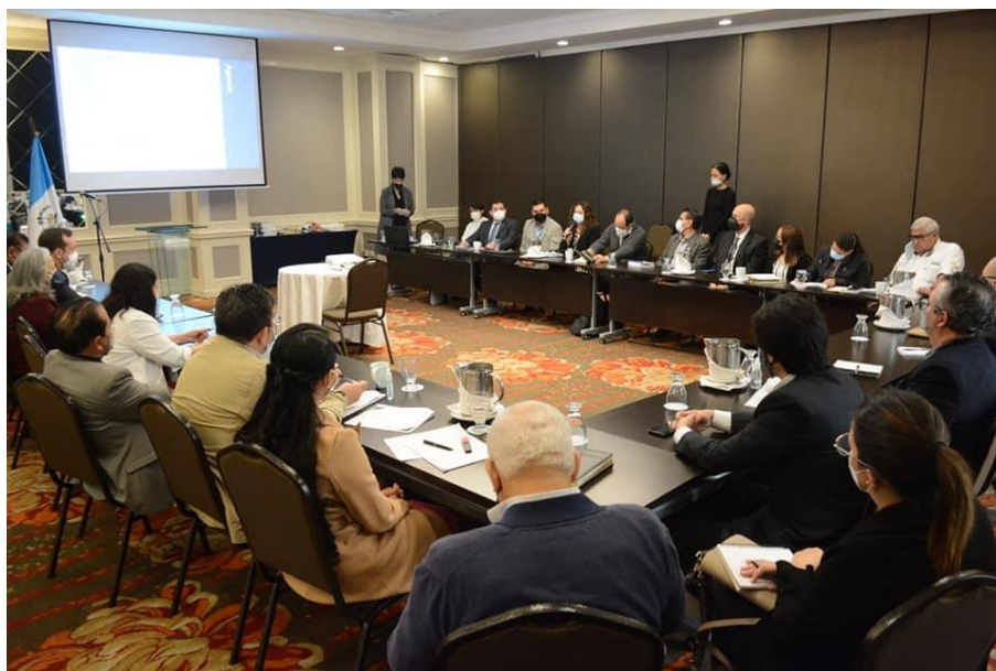
Participación de la COPRESAM en taller para la actualización de la Política Nacional del Sector Agua Potable y Saneamiento

Durante este taller se planteó por parte de los participantes las principales problemáticas y obstáculos que se han tenido para dar cumplimiento a las metas planteadas en la actual política, y se manifestó la importancia de proponer una actualización de la política que cuente con un plan de seguimiento y evaluación, y que exista una institución que tenga la capacidad de liderar y articular los esfuerzos de los diferentes actores en el país, y así facilitar y mejorar los servicios de agua y saneamiento. Esta actividad contará con un respectivo seguimiento para dar continuidad a los acuerdos alcanzados en este taller.