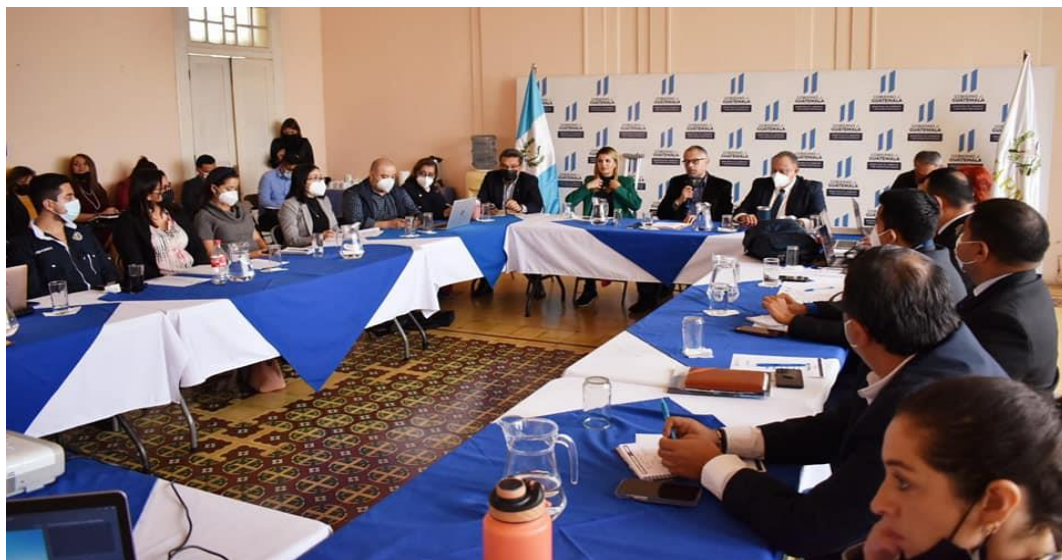
Reunión de la mesa técnica nacional de Cambio Climático

La COPRESAM continuará participando en las siguientes convocatorias a esta mesa técnica, que facilitará la formulación de una propuesta consensuada de la Ley de Agua.