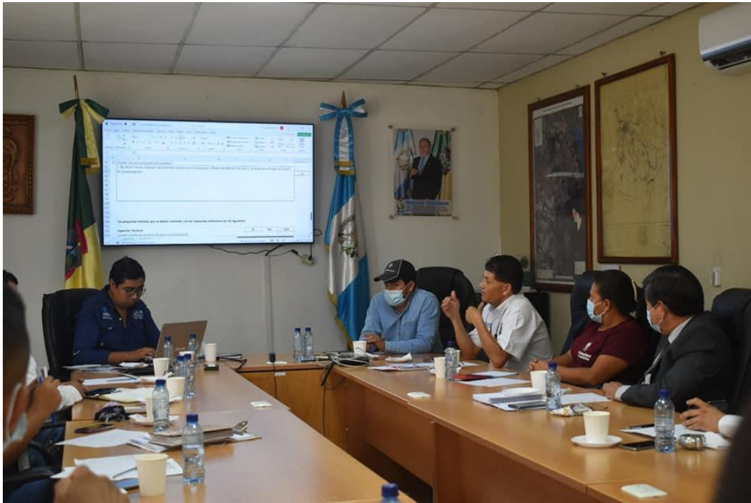
Visita a la municipalidad de Amatlán, para dar a conocer la estrategia de las OMAS