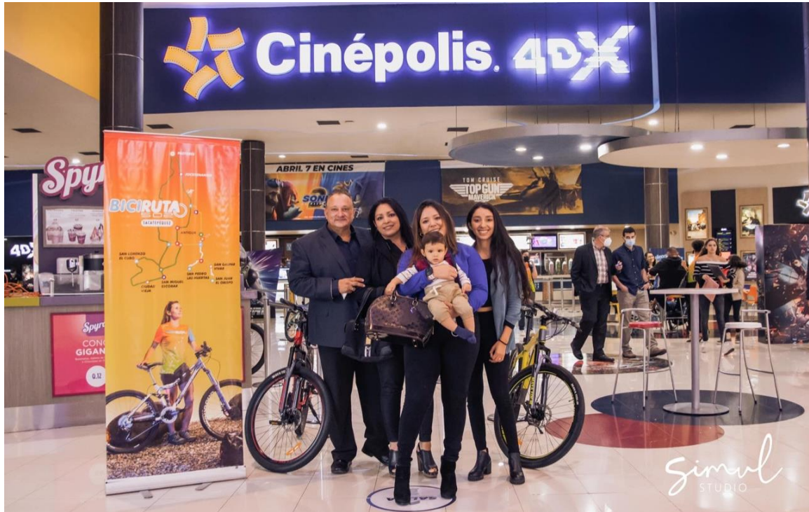
Presentación del documental Biciruta502, día 9 de agosto