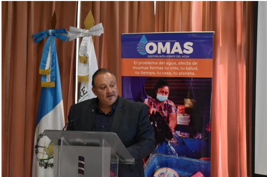
Reunión con autoridades y representantes de instituciones que conforman la Mesa de Implementación para la estrategia OMAS