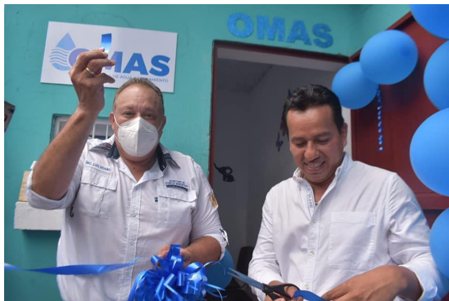
Actividad de inauguración de la OMAS en San Felipe, Retalhuleu