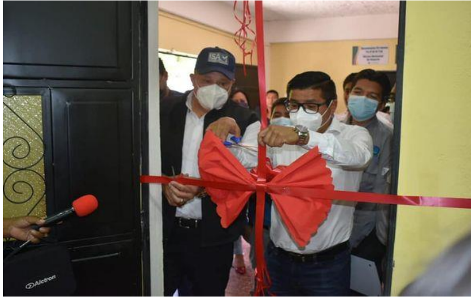
Actividad de inauguración de la OMAS en San Marcos la Laguna, Sololá