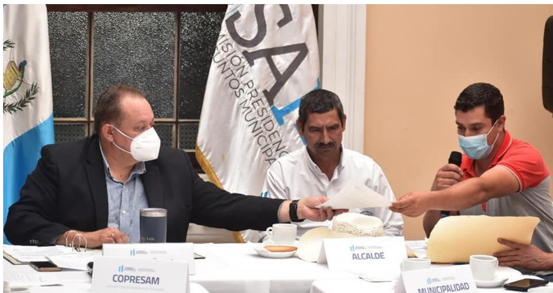
Reunión donde la municipalidad de San Agustín Acasaguastlán hace entrega del expediente para acompañamiento de la COPRESAM, para solicitud de mantenimiento a tramo carretero

Producto del acompañamiento de la COPRESAM, a finales del mes de agosto el CIV informa que, hasta el momento, este camino era un camino rural, y ahora pasará a ser la “Ruta Departamental el Progreso No. 28”, que corresponde a un total de 30.5 kilómetros de carretera, los cuales recibirán mantenimiento.