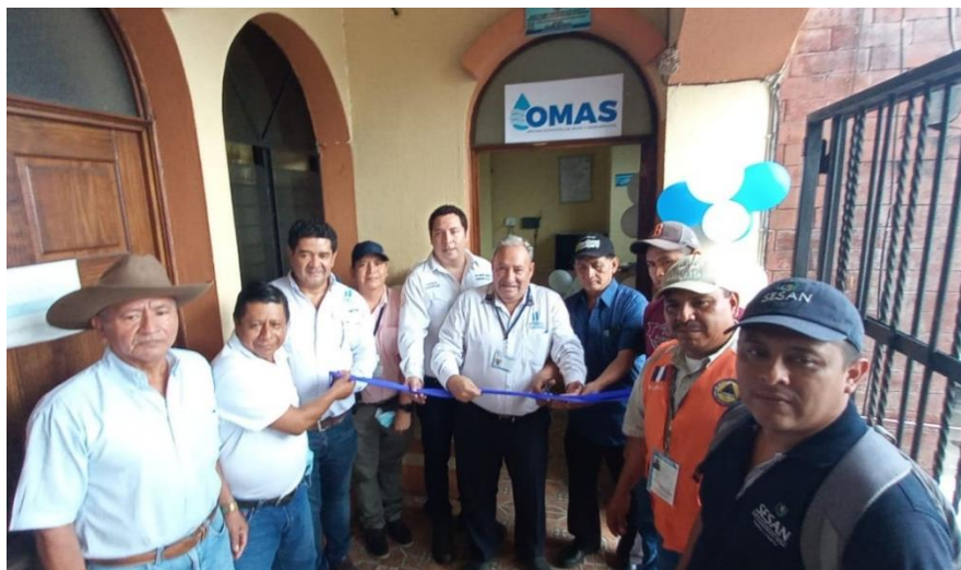
Actividad de inauguración de la OMAS en San Gabriel, Suchitepéquez