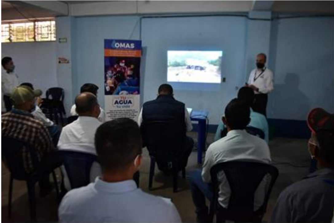
Visita a la municipalidad de Oratorio, Santa Rosa, para dar a conocer la estrategia de las OMAS

Como parte de las acciones de seguimiento, las municipalidades que ya han creado su OMAS mediante Acuerdo Municipal, y que ya han asignado un espacio físico para su respectivo funcionamiento, coordinan junto con la COPRESAM para que se lleven a cabo actos de inauguración y de esta manera oficializar la creación de sus respectivas Oficinas de Agua y Saneamiento. De mayo a agosto 2022 se llevaron a cabo las siguientes actividades de inauguración de OMAS.