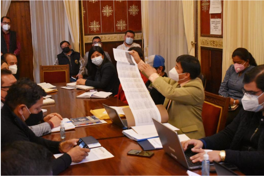
Entrega de peticiones por parte de representantes del Valle Palajunoj y la municipalidad de Quetzaltenango, durante el proceso de diálogo para el PLOT