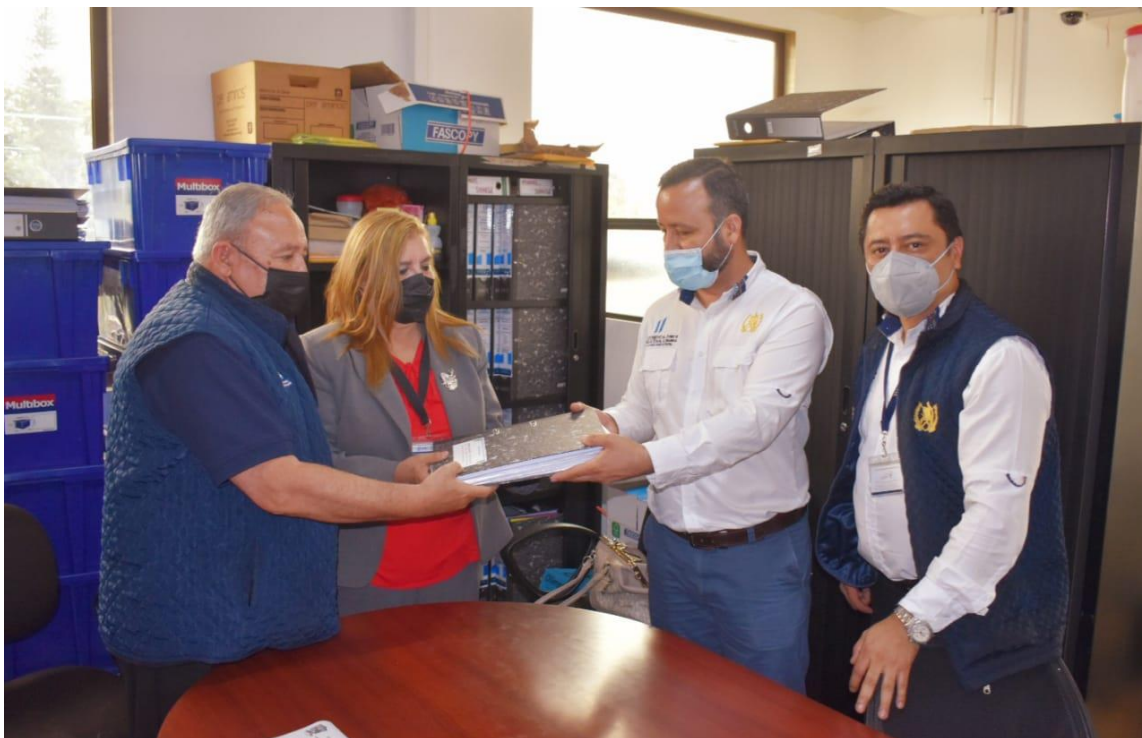
Acompañamiento a la municipalidad de Malacatancito para ingresar expediente a FODES, para construcción de sistema de agua potable