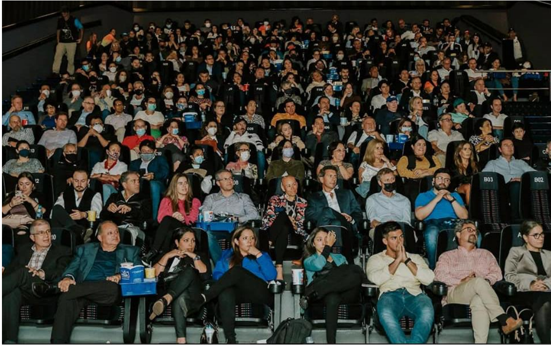
Participación en la presentación del documental de la Biciruta 502, el 24 de mayo

El nueve de agosto se realiza de nuevo la presentación de este documental, en Cinépolis las Américas, actividad en la cual estuvieron presentes distintos conglomerados de sociedad civil, sector empresarial e invitados especiales.