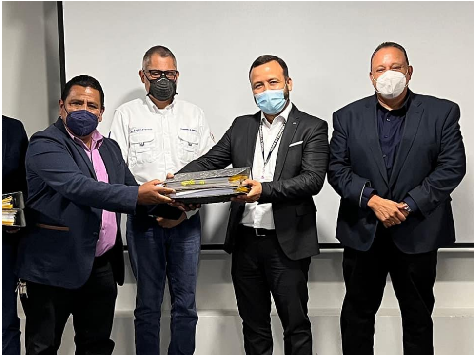
Entrega del expediente completo para la ampliación de la Planta de Tratamiento Tzanjuyú en Panajachel, para revisión final

Posteriormente a inicios de agosto, la SEGEPLAN traslada una copia del resultado de la opinión técnica del proyecto, en el cual solicitan que previo a continuar con el seguimiento, se debe subsanar lo establecido en las observaciones realizadas por la SEGEPLAN.