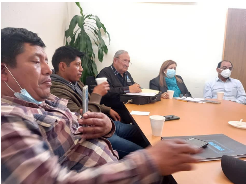
Acompañamiento de la COPRESAM a la municipalidad de Santa Bárbara, Huehuetenango, ante el CIV para conocer el seguimiento al proyecto de mantenimiento de carretera