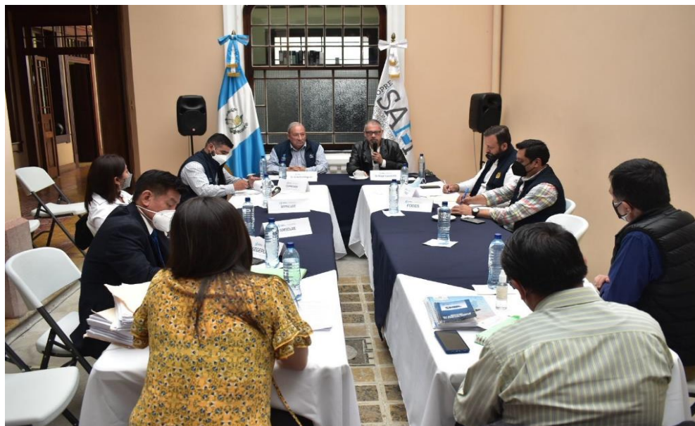
Reunión del día 8 de agosto, personal de la SEGEPLAN entrega resultados de la opinión técnica al expediente de la planta de tratamiento Tzanjuyú