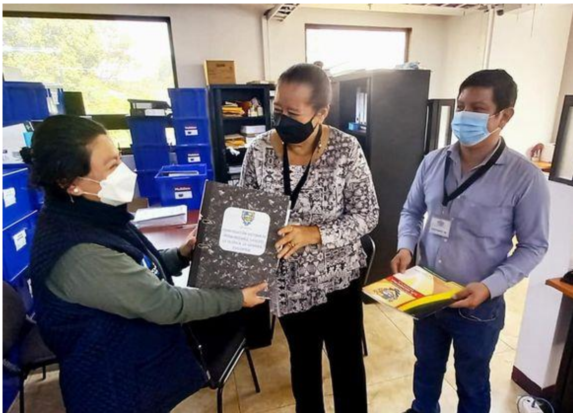
Acompañamiento a la municipalidad de la Gomera, Escuintla, para ingresar ante FODES, expediente de construcción de sistema de agua potable a