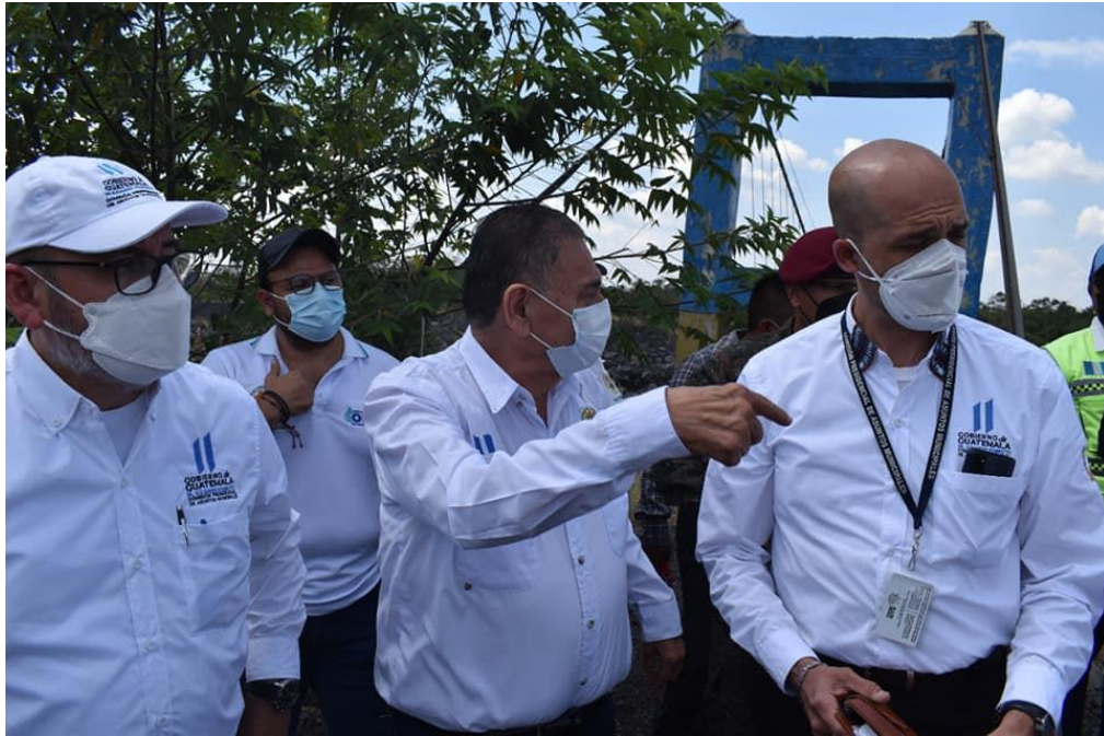
Visita de campo por parte de la COPRESAM a los alrededores del Río Ceniza