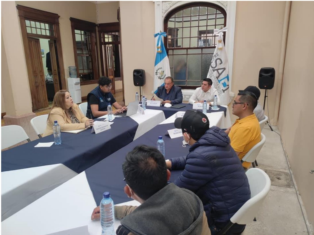
Reunión con la municipalidad de Santiago Chimaltenango, Huehuetenango y Dir. General de Caminos, en seguimiento a expediente para mantenimiento a tramo carretero

En esta actividad, se establece una hoja de ruta para dar continuidad a la solicitud. La municipalidad con el acompañamiento de la COPRESAM deberá solicitar al director general de Caminos la modificación de algunas cláusulas para el contrato de rescisión con la empresa que actualmente tiene a cargo este proyecto. Posterior a ello, el director general de Caminos deberá emitir resolución para aprobar las modificaciones y se realizará una reunión de seguimiento a inicios del mes de septiembre para continuar con el proceso.