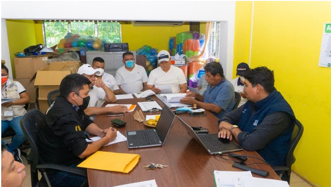
Visita a la municipalidad de el Jícara, el Progreso para dar a conocer la estrategia de las OMAS