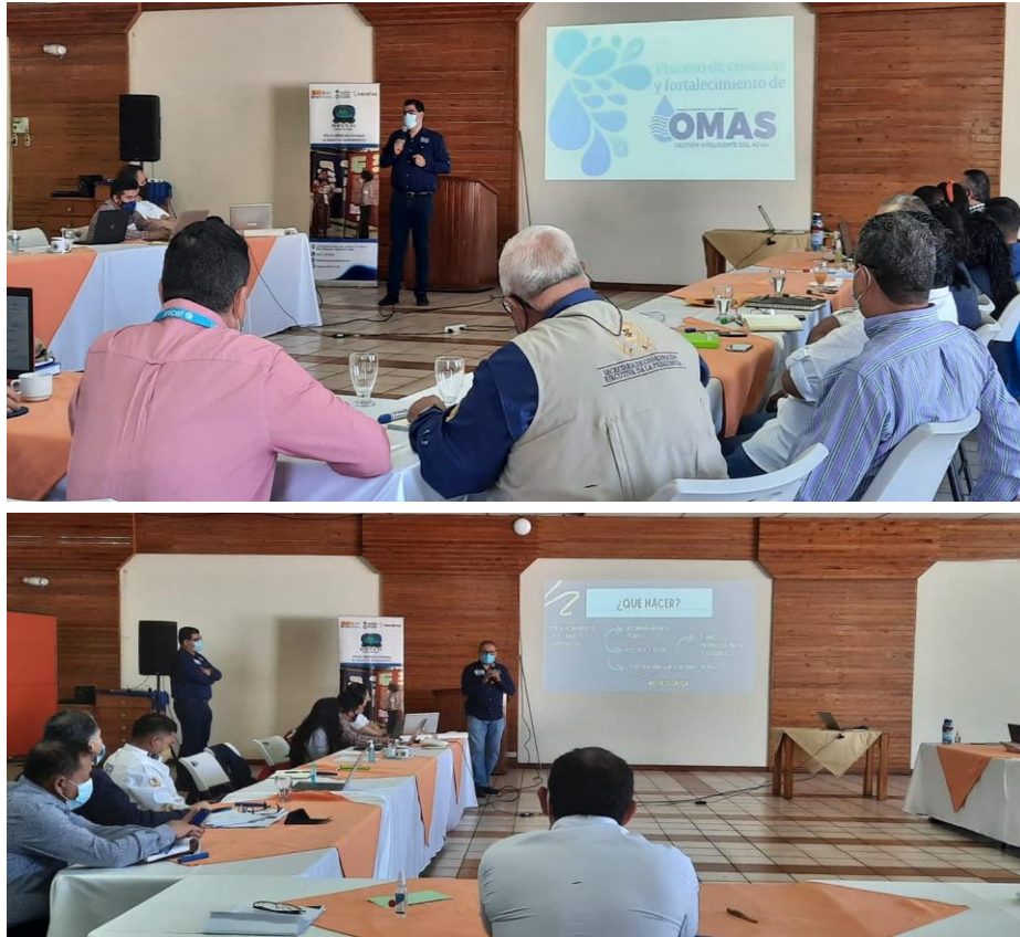
Participación de la COPRESAM en Taller para conocer el modelo ASH

autoridades de las instituciones que conforman el equipo de implementación, firmen los compromisos adquiridos, para garantizar la continuidad a esta importante propuesta.