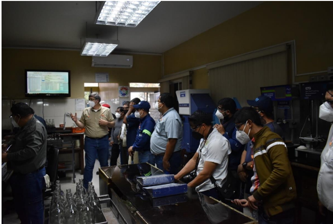
Recorrido en la planta de reciclaje de VIGUA, por parte de las municipalidades de Siquinalá, Jocotenango y San Lucas Tolimán