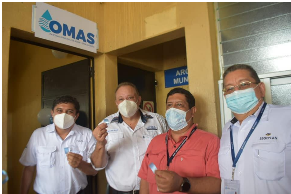
Inauguración OMAS en Santa Cruz Muluá