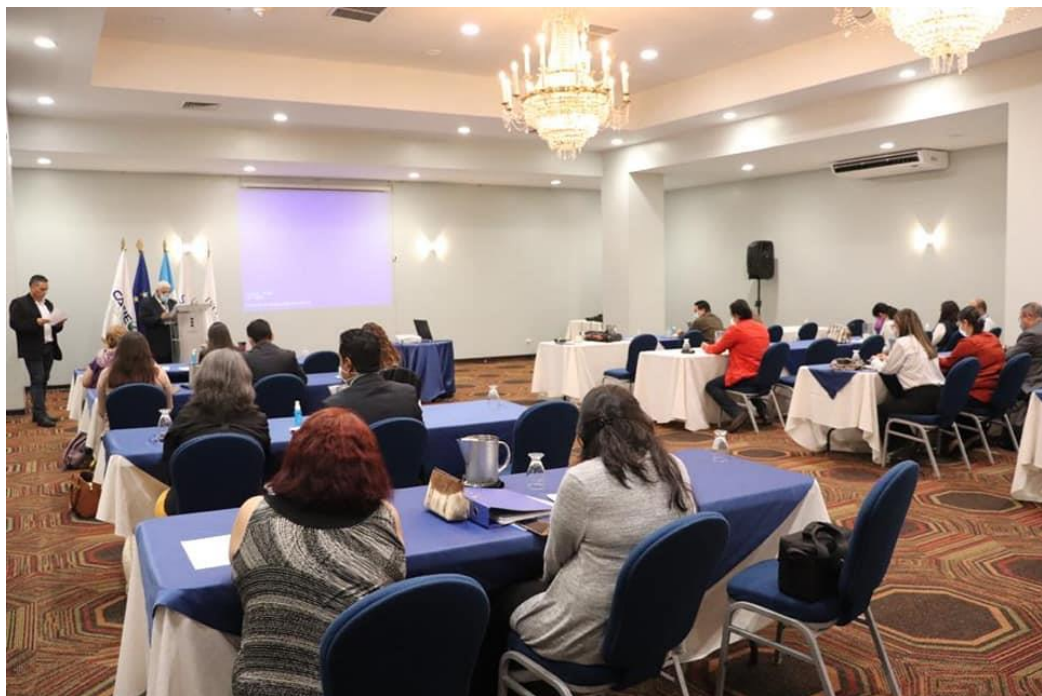
Participación de la COPRESAM en reunión del Comité Técnico Interinstitucional, CONASAN