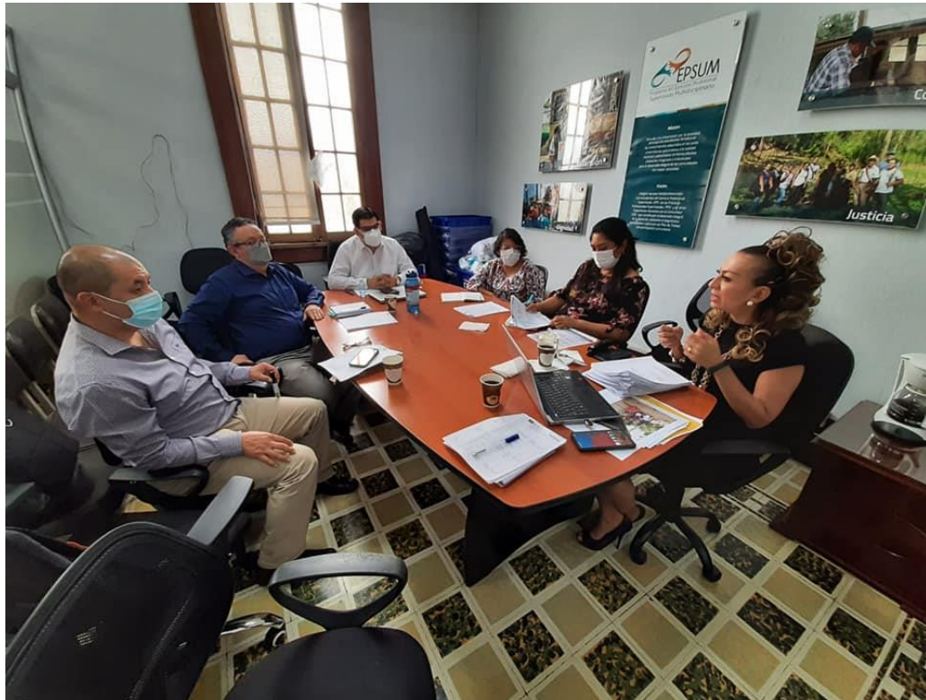
Reunión con RASGUA y EPSUM, en seguimiento al diplomado de Gestión Inteligente del Agua

Debido a dificultades con la plataforma virtual de la USAC, este diplomado se había suspendido temporalmente. Sin embargo, en el mes de septiembre se reanudará, iniciando con el tema de la Importancia y formas de participación ciudadana con relación al uso del agua.