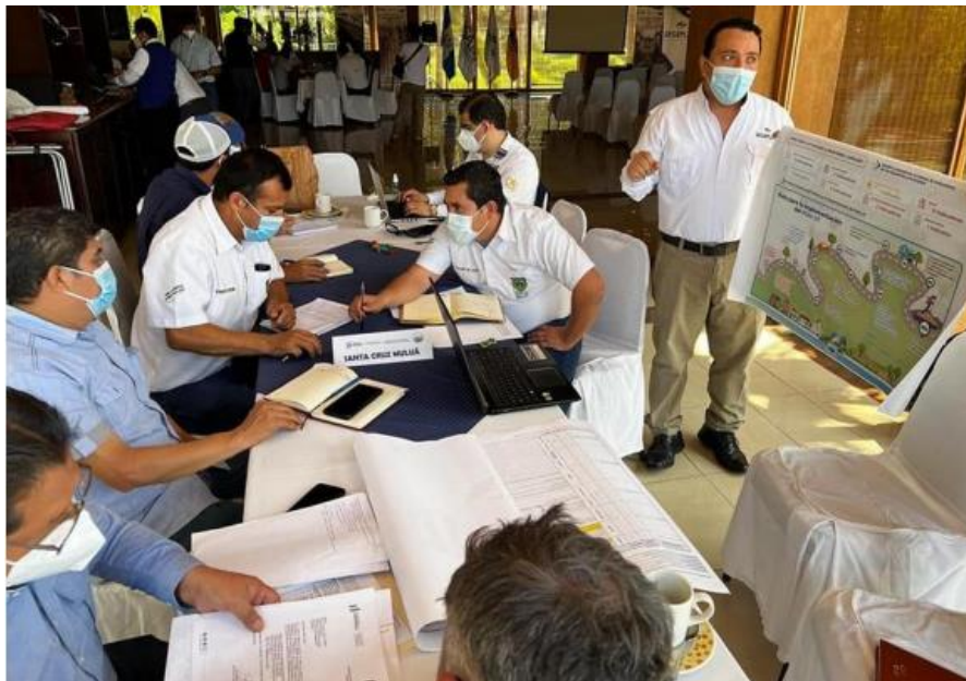
Actividad para implementación de los PDM-OT en Retalhuleu

Otra de las acciones importantes que se desarrollaron en estos municipios a partir de la creación de la mancomunidad, es la actividad desarrollada el día tres de marzo en Retalhuleu, con la cual se dio inicio a la gira para promover la implementación de los PDM-OT, acción que se trabajó en coordinación con la SEGEPLAN. En dicha actividad estuvieron presentes representantes de Santa Cruz Muluá, San Martín Zapotitlán y San Felipe Retalhuleu.