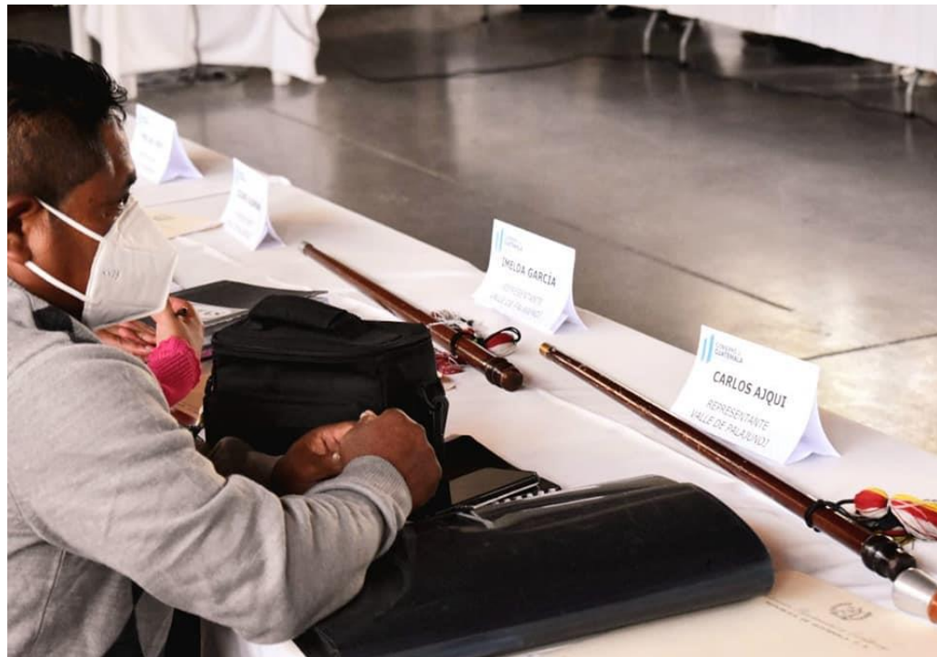
Reunión del 29 de junio, para dar seguimiento al diálogo para la formulación del PLOT del Valle Palajunoj