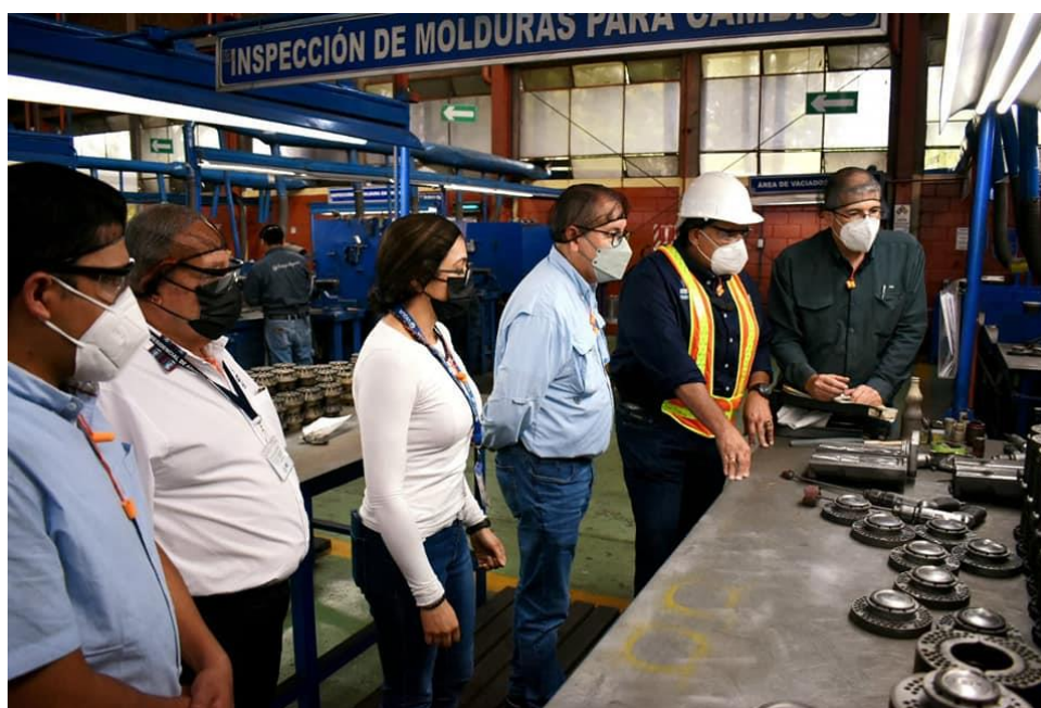
Personal de COPRESAM durante recorrido en planta de la Vidriera Guatemalteca, conociendo el proceso para la creación de vidrio

Gracias a acercamientos, la COPRESAM coordina acciones para promover el reciclaje a nivel municipal, por lo cual se realizó una propuesta para que el día 25 de agosto, tres municipalidades pudieran realizar una visita a la planta de VIGUA, para conocer el proceso de reciclaje de vidrio, y a la vez generar conciencia sobre la importancia y los beneficios del uso de vidrio.