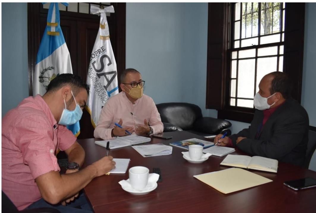
Reunión con el MSPAS para abordar el tema de implementación de las Oficinas de Avaes Sanitarios

Producto de esta reunión, la COPRESAM dará el acompañamiento para la conformación de una mesa técnica que facilite la creación de una hoja de ruta de implementación y fortalecimiento de las OAS, las cuales serán las encargadas de realizar acciones para los avales para la ejecución de proyectos de agua y saneamiento.