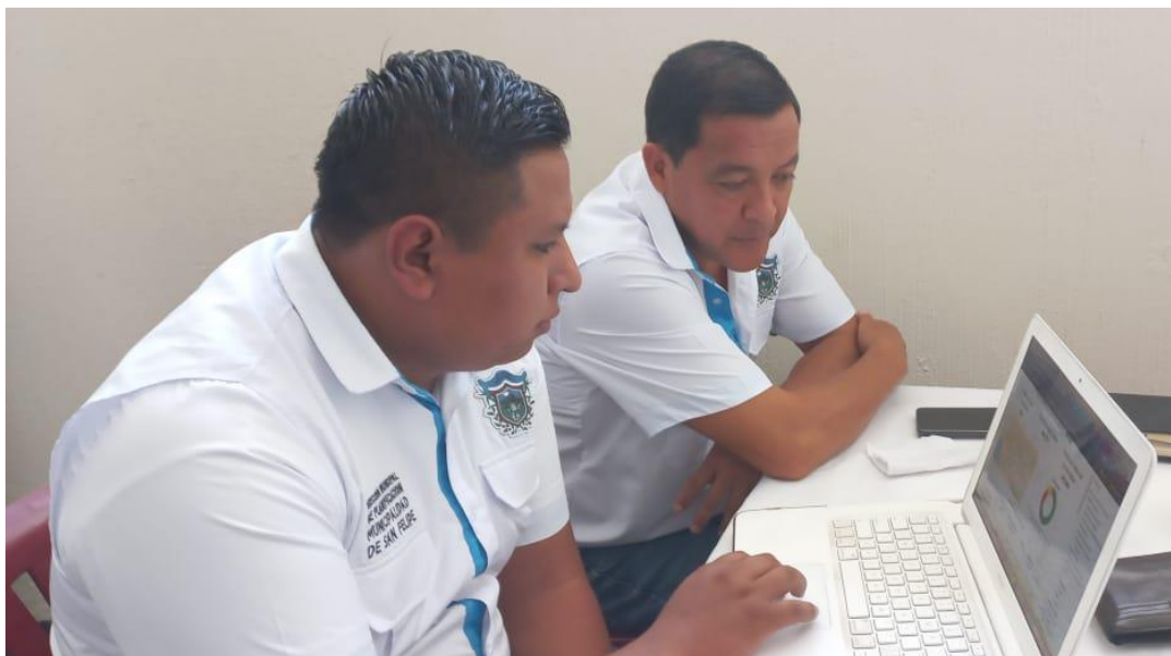
Plan piloto de capacitación sobre Modelo mWater a municipalidades de Suchitepéquez y Retalhuleu