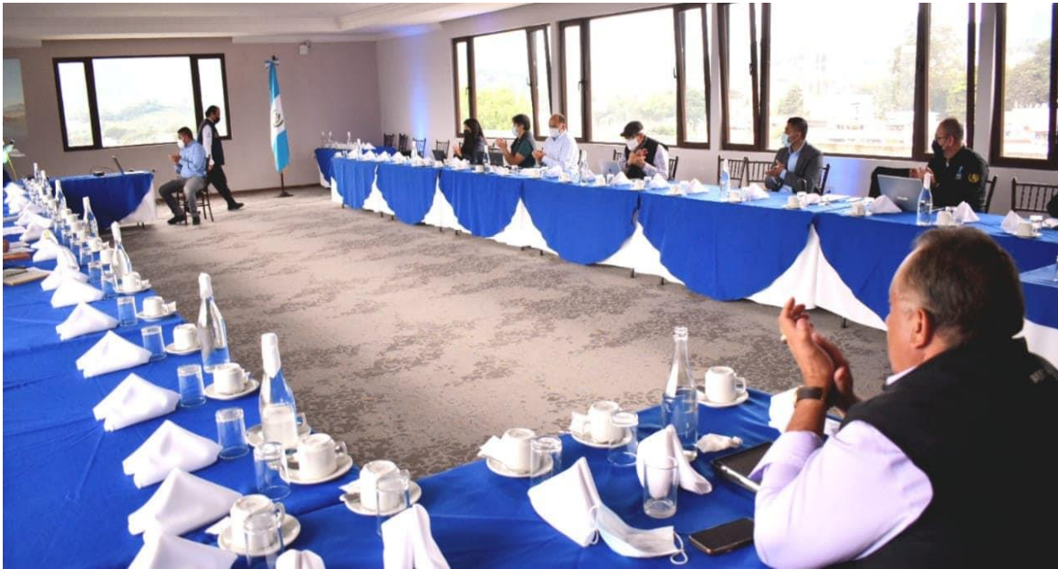
Participación de la COPRESAM en reunión con la Misión del BID en el departamento de San Marcos

Una segunda parte de esta actividad, consistió en realizar un recorrido junto a la Misión del BID, autoridades del MARN, INFOM y la COPRESAM, para observar la fase final de dos plantas de tratamiento de aguas residuales ubicadas estratégicamente en San Pablo, San Marcos y financiadas por el BID, administradas y supervisadas por el INFOM.