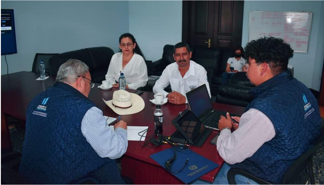
Reunión de seguimiento con el señor alcalde de San Agustín Acasaguastlán, con relación a expediente para solicitud de mantenimiento a tramo carretero