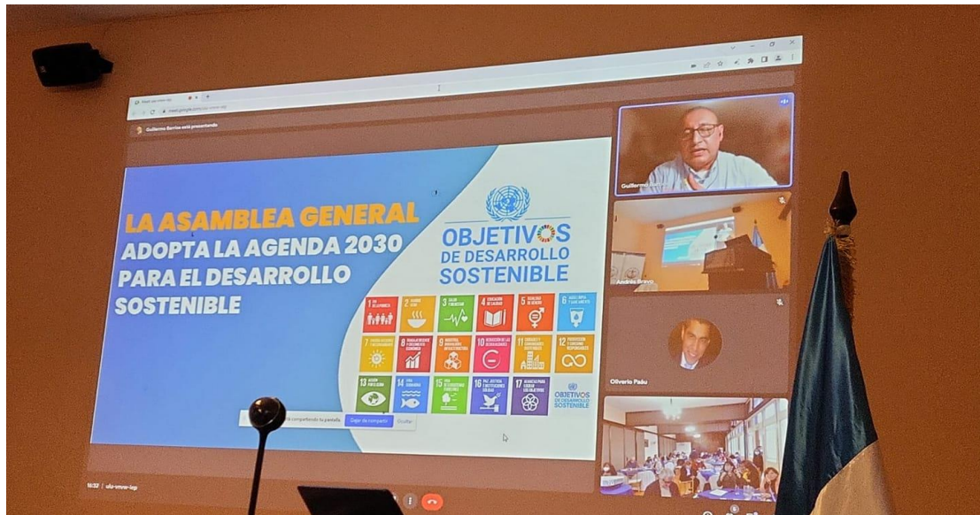
Participación de la COPRESAM en el Foro “Logros y Desafíos en el Fortalecimiento del Sistema de Salud”