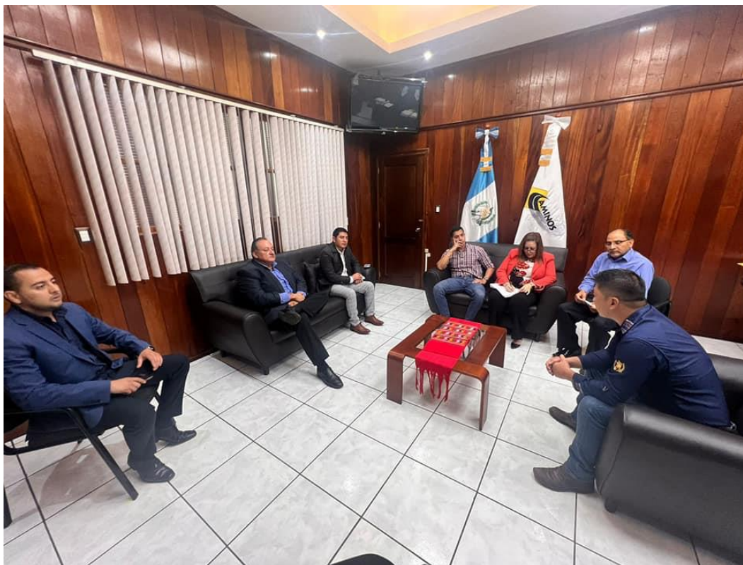
Reunión de seguimiento con alcalde de Santiago Chimaltenango en instalaciones de la Dir. Gral. de Caminos