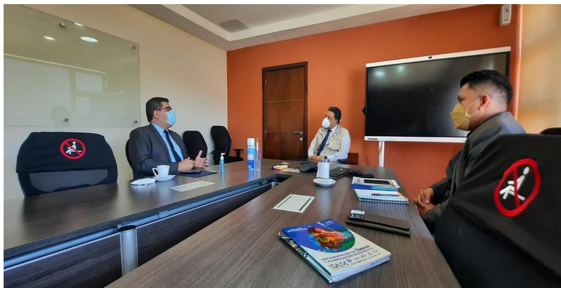
Reunión de la COPRESAM con el gerente general de INTECAP, en la búsqueda de apoyo para implementar programa de fortalecimiento de capacidades

Como resultado de esta reunión, se acordó junto con el gerente de INTECAP, llevar a cabo reuniones de seguimiento y el intercambio de información para plantear una ruta de trabajo.