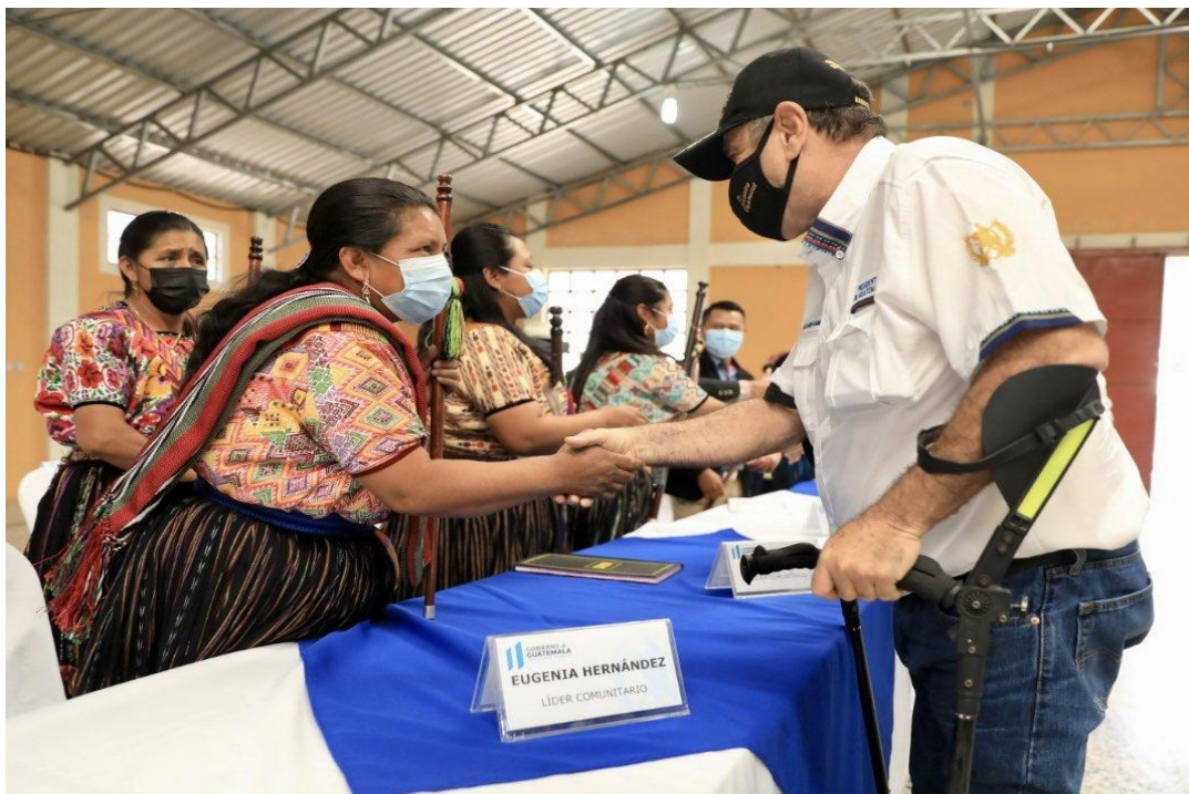
Primera reunión con representantes de Valle Palajunoj, estando presente el Señor Presidente de la República

Posteriormente el 26 de mayo se entrega un documento unificado con las peticiones recibidas por las partes involucradas. La COPRESAM presenta una propuesta de la ruta a seguir para la formulación e implementación del PLOT y se somete a consideración y aprobación. Se aprueba que el proceso se desarrolle realizando un plan de trabajo, un diagnóstico de la situación actual y mesas de trabajo de participación ciudadana.