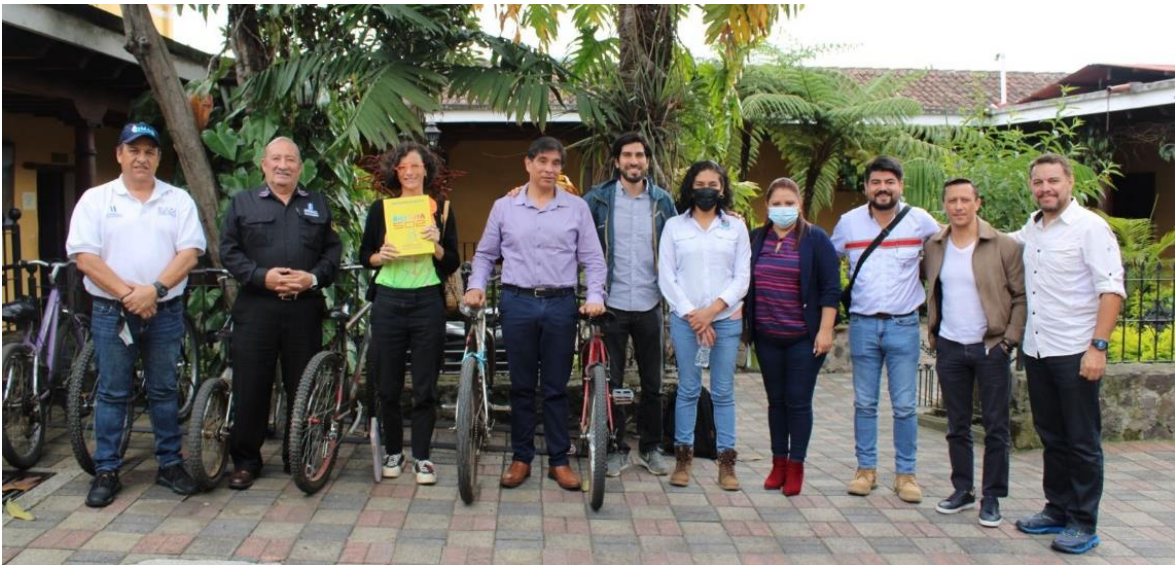
Reunión del día 17 de agosto con el alcalde y personal municipal de Ciudad Vieja, La Nueva Narrativa y la COPRESAM, dando seguimiento a acciones para implementación de la Biciruta 502

Todos estos resultados han contado con el debido acompañamiento de la COPRESAM, lo que ha facilitado la coordinación de las distintas acciones.