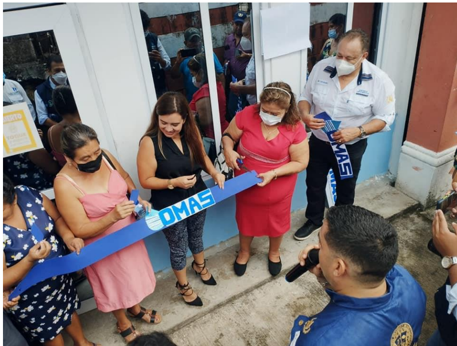
Actividad de inauguración de la OMAS en San Martín Zapotitlán, Retalhuleu