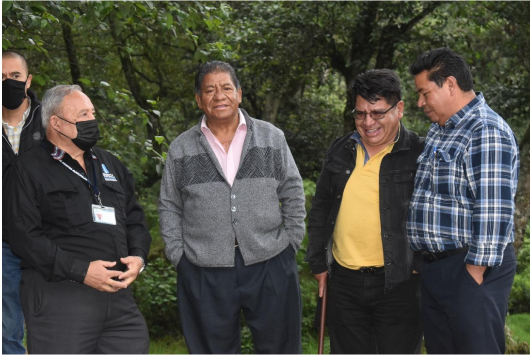
Reunión y recorrido para abordar el tema del mejoramiento de carretera entre Tecpán y Patzún